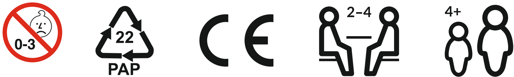
Symbole zur freien Verwendung.